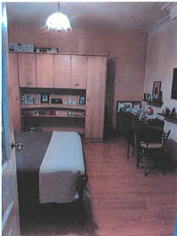
chambre milieu 2ème étage ( sans fenêtre