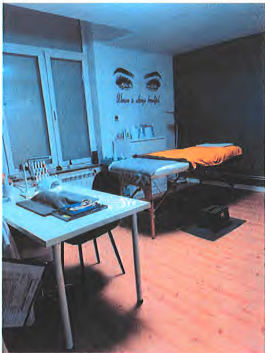
1190 Forest Avenue Van Volxem 373