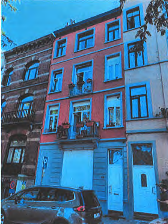
cabinet podologie rdc