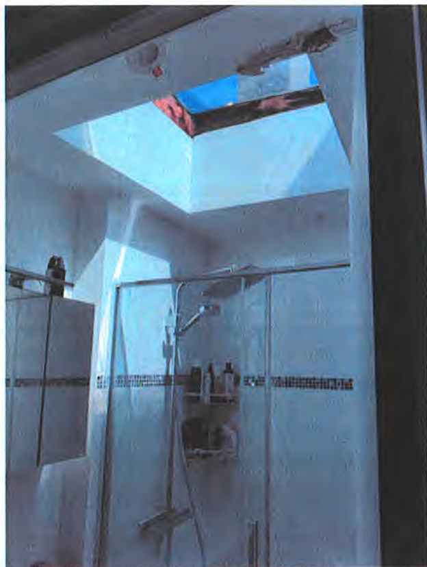
salle de bains 3ème étage