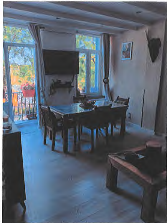
séjour entresol 1-2ème étage