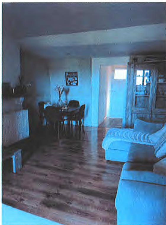
séjour 3ème étage