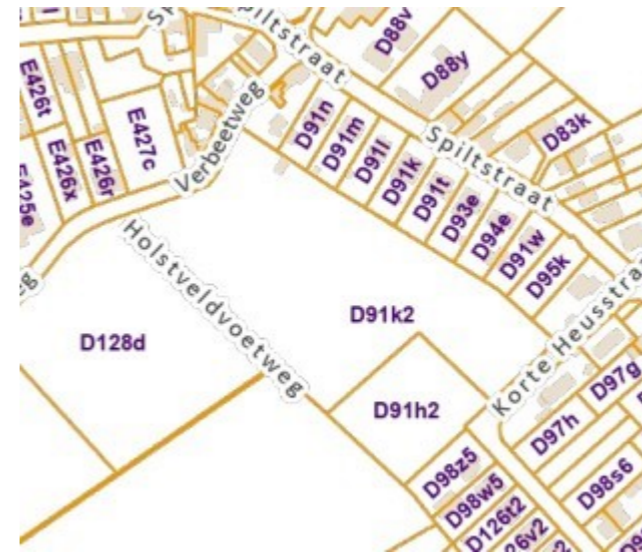
kadastplan Schaal 1/5000