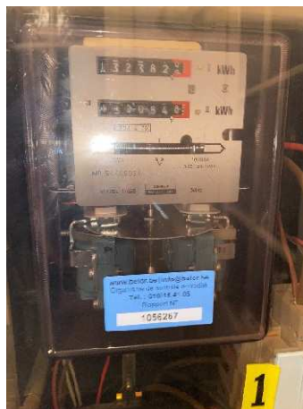
Tableau électrique principal