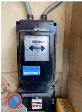
Tableau électrique principal