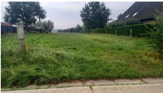
perceel 228X aan Mechelbaan