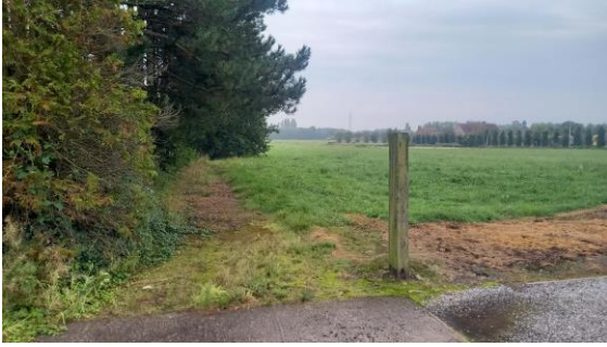
recht van uitweg thv. percelen 228P en 225T