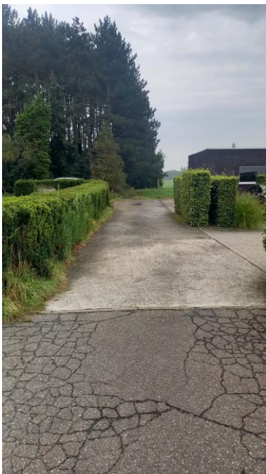
zijweg Mechelbaan waarop Recht van uitweg