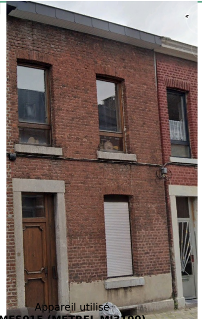
Appareil utilisé MES015 (METREL MI3100)