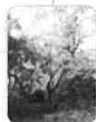
Tétradium de Daniel Ixelles Parc Tenbosch