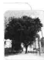
Acer platanoides f. schwedleri Ixelles Plaine Renier Chalon Rue Renier Chalon