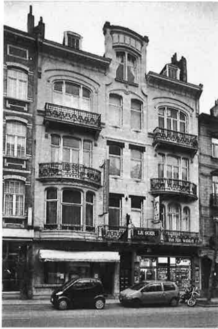
Waterloosesteenweg 591 en 589., 2007

Brussels Hoofdstedelijk Gewest INVENTARIS VAN HET BOUWKUNDIG ERFGOED