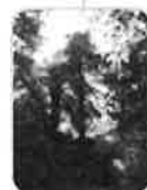
Sequoia sempervirens Ixelles Parc Tenbosch