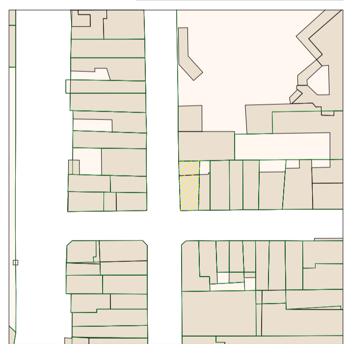
Kadasterplan - Schaal 1/1000

Plan opgemaakt met behulp van: - Opgemeten bestaande toestand door Landmeterskantoor Van Eester BVBA dd. 10 juli 2025. - Atlas der buurtwegen 1841. - Feitelijk vermoeden grens midden muur. - Schets 4 - 1925