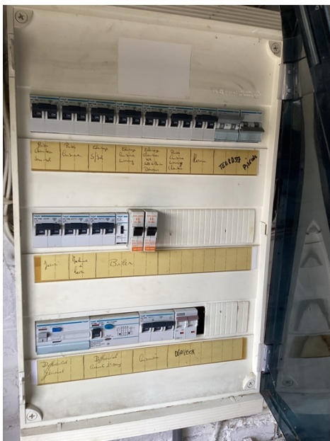
( Tableau électrique )