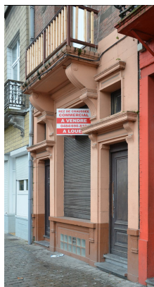
Rue du Transvaal 69, rez-de-chaussée, (© ARCHistory, 2019)