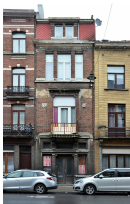
Rue Émile Carpentier 11, (© ARCHistory, 2019)