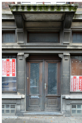
Rue Émile Carpentier 11, entrée, (© ARCHistory, 2019)