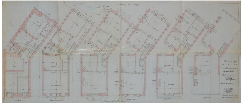
Rue Émile Carpentier 11 et rue du Transvaal 69, plans terriers, ACA/Urb. 9689 (11.12.1903)