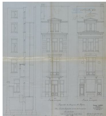
Rue Émile Carpentier 11 et rue du Transvaal 69, élévations, ACA/Urb. 9689 (11.12.1903)