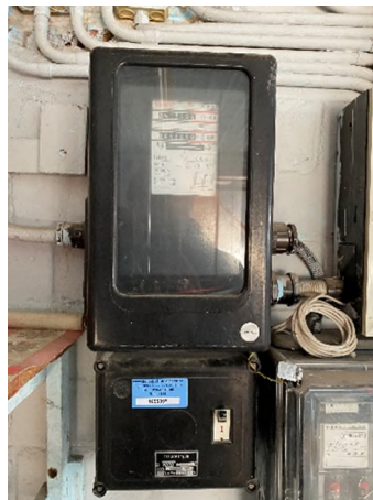
Tableau électrique principal