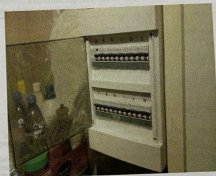
Visualisatie van de installatie

Teller nr. 20349217 Index : 26800 / 22789