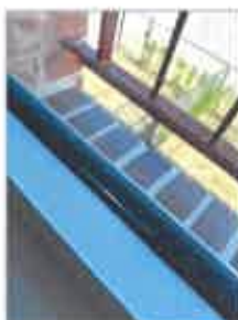
Foto 14 april 2026 om 11:44