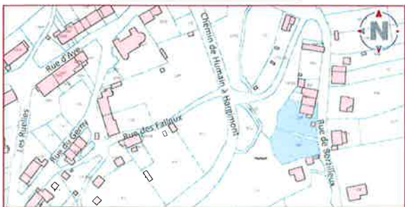
Situation sur extrait cadastral : 1:2500

Les données cadastrales de ce document appartiennent exclusivement à l'Administration Générale de la Documentation Patrimoniale.