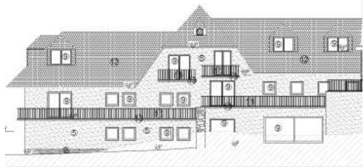
Façades Est (Situation projetée)