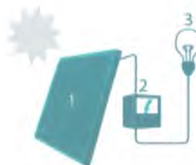
1 Zonnepaneel | 2 Omvormer | 3 Elektrische installatie

Om de zonnepanelen optimaal te laten renderen, plaatst u ze tussen oostelijke en westelijke richting onder een hoek van 20° tot 60°.