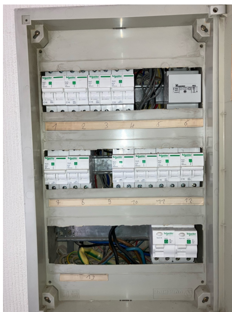
( Elektrisch bord )