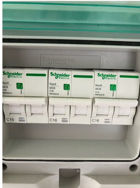
( Elektrisch bord )